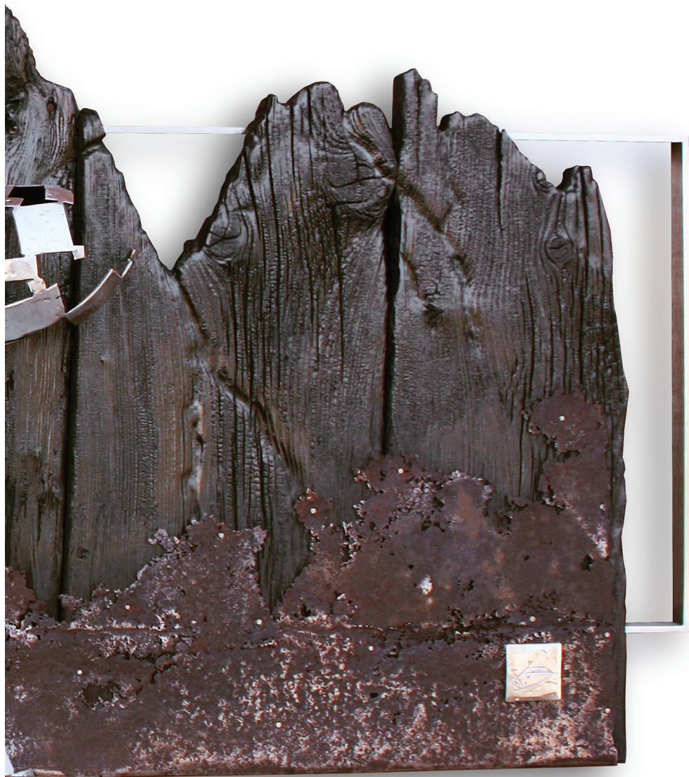
Andrea Borga Eco di montagna (part.) 2023, Acciaio inox, legno di larice secolare carbonizzato, lamiera in ferro corrosa cm. 60 (h) x 150 x 17