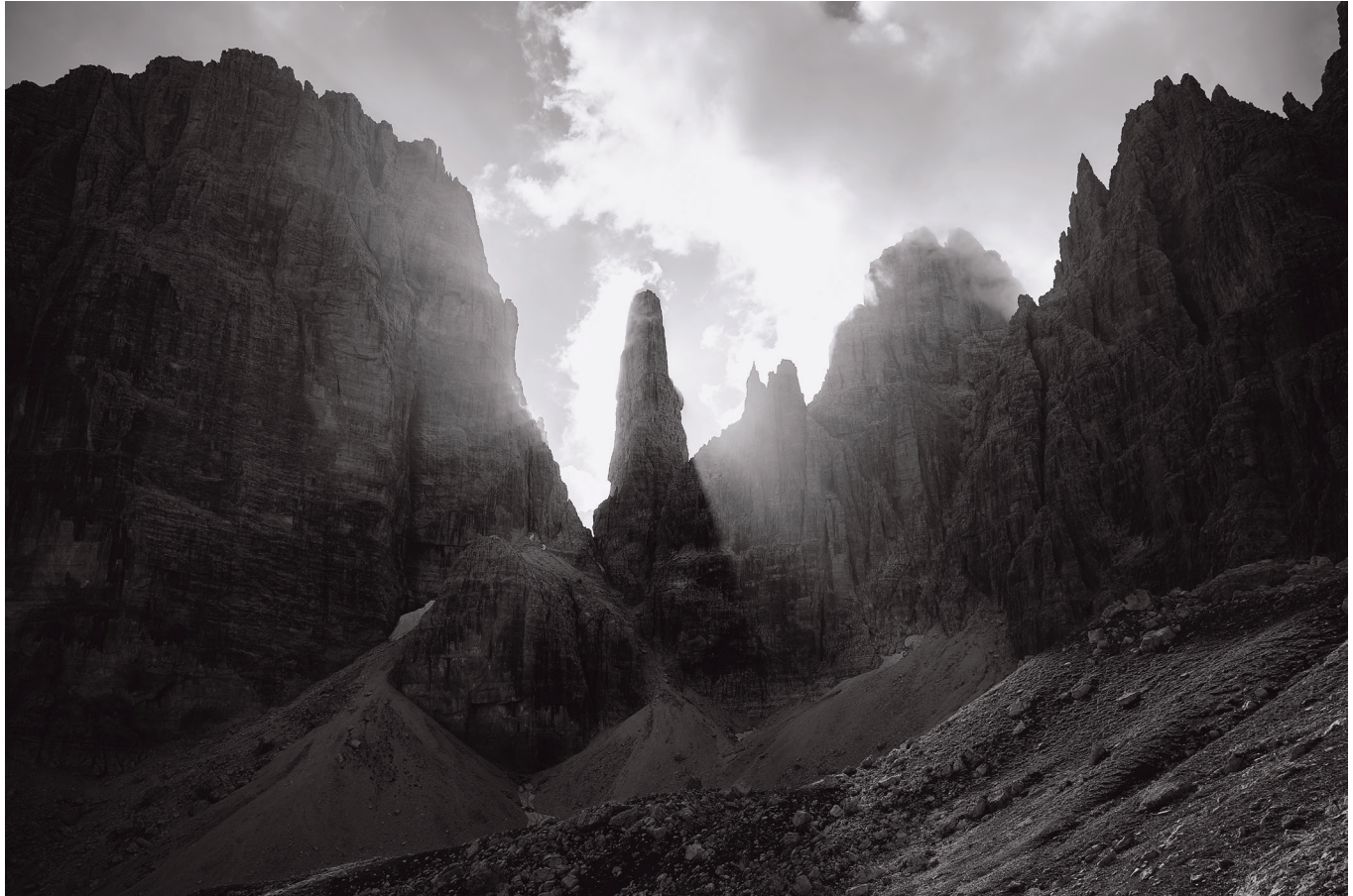
Massimiliano Corradini Campanil Basso, La Sentinella, Campanile Alto, Sfulmini 2018, Fotografia in bianco e nero Stampa su carta fine art 350g, cm. 50 x 70