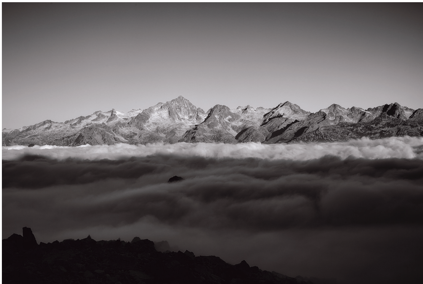
Massimiliano Corradini Il Gruppo della Presanella all'alba 2018, Fotografia in bianco e nero Stampa su carta fine art 350g, cm. 50 x 70