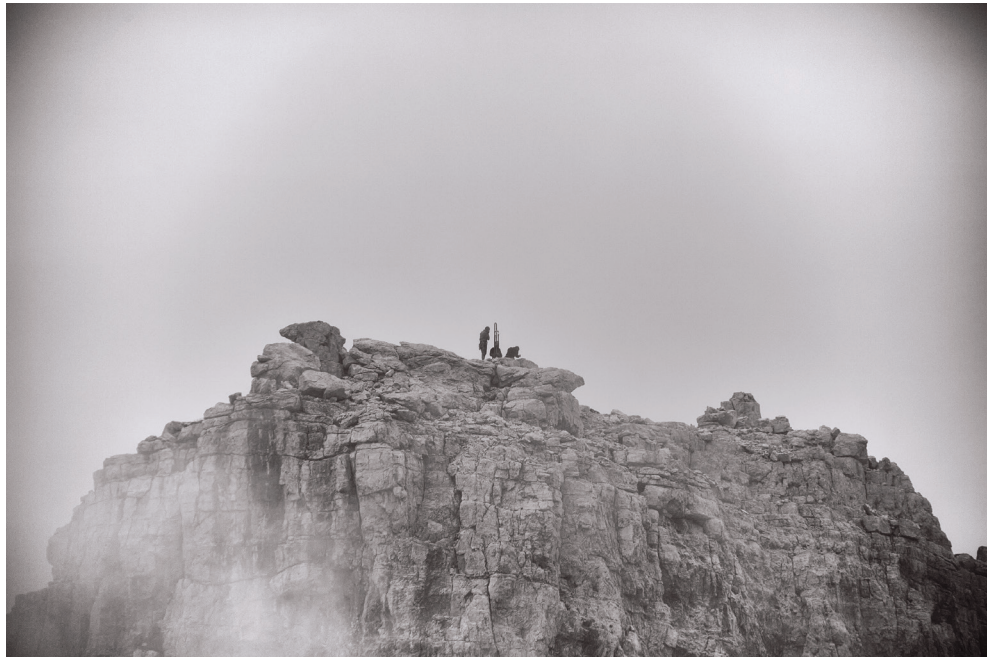
Massimiliano Corradini Campanil Basso 2018, Fotografie in bianco e nero Stampa su carta fine art 350g, ciascuna cm. 50 x 70