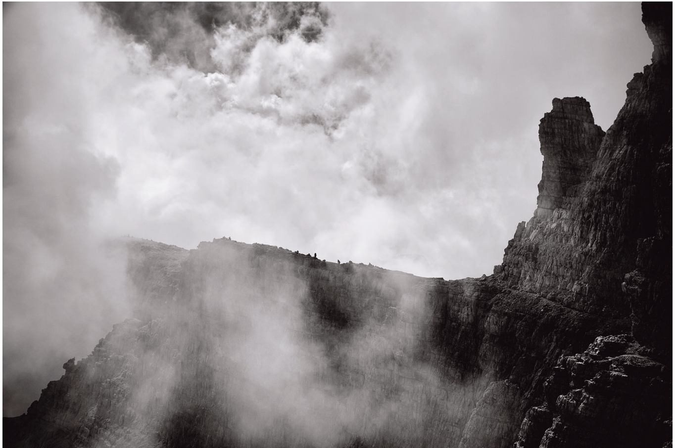
Massimiliano Corradini Sentiero delle Bocchette Alte 2018, Fotografia in bianco e nero Stampa su carta fine art 350g, cm. 50 x 70