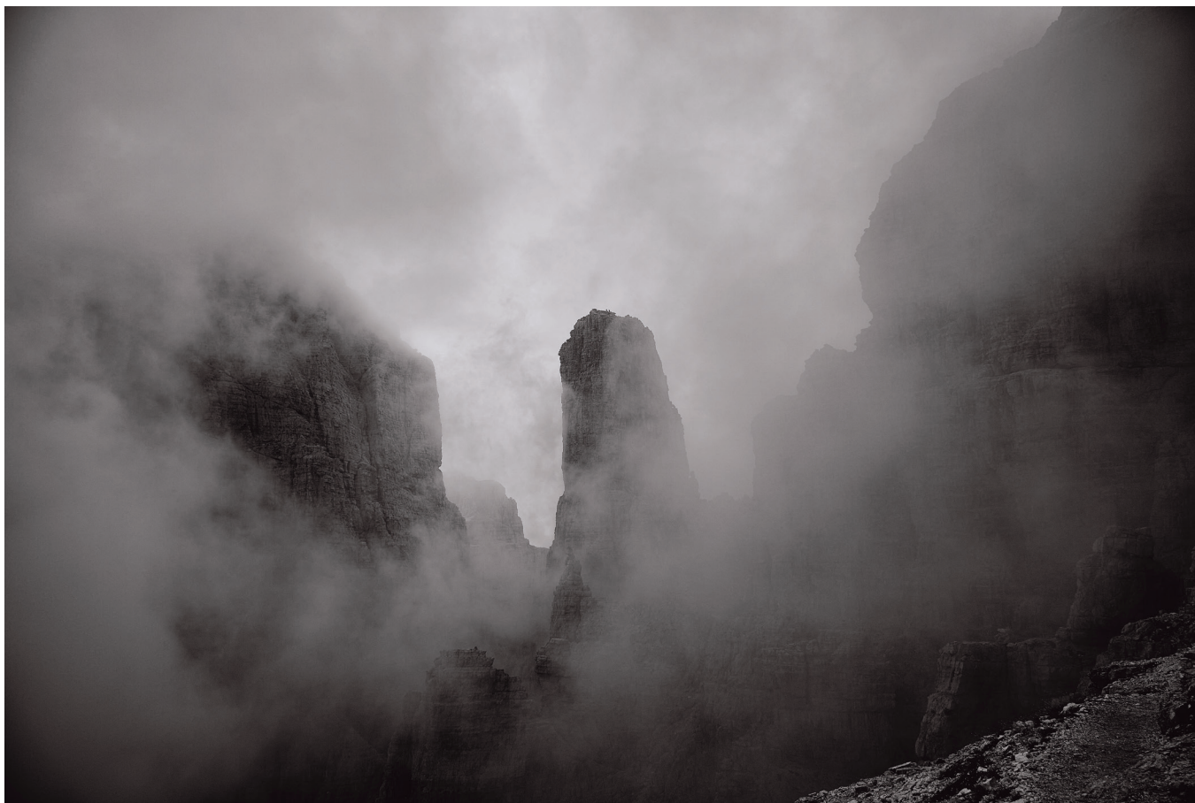
Massimiliano Corradini Campanil Basso dalla Ferrata Felice Spellini 2018, Fotografia in bianco e nero Stampa su carta fine art 350g, cm. 50 x 70