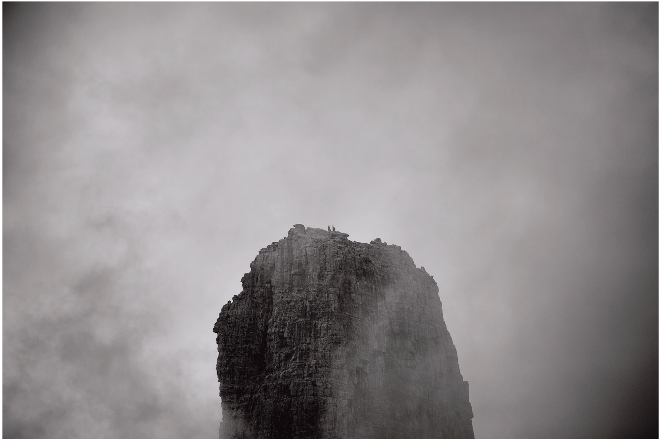
Massimiliano Corradini Campanil Basso 2018, Fotografia in bianco e nero Stampa su carta fine art 350g, cm. 50 x 70